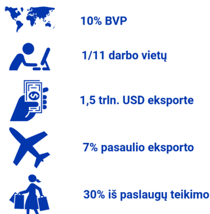
3 pav. Turizmo ekonominė ir socialinė nauda Šaltinis: UNWTO 2

vienuolikos darbo vietų yra sukuriama turizmo sektoriuje (3 pav.). Turizmas yra trečias pagal dydį ekonominis sektorius pasaulyje.